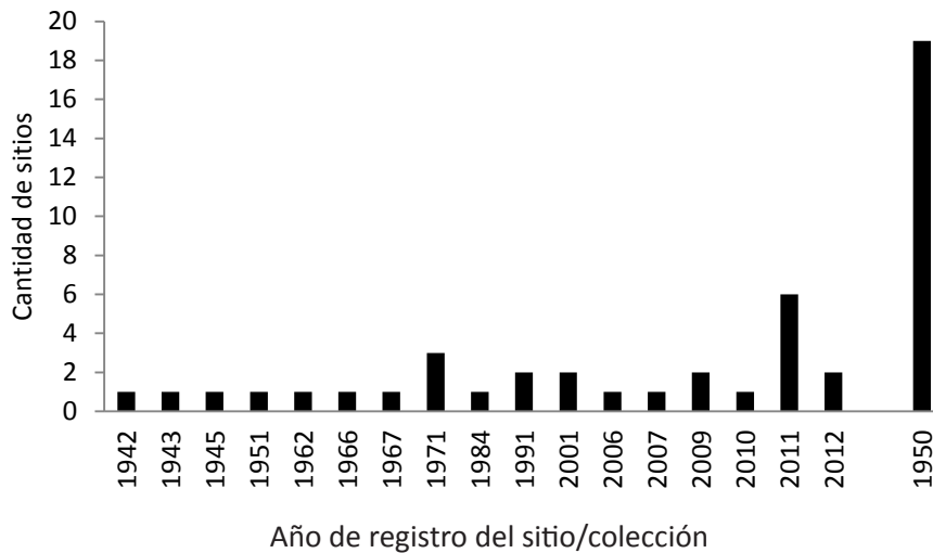
Figura 6.3.2. Cantidad de sitios arqueológicos investigados de acuerdo al año (Colón).

Avanzado la década del 2000 se han registrado la mayor cantidad de sitios para el área (66% del total registrado) producto tanto de rescates arqueológicos (5)(e.g. Fabra 2008, Salega 2011), la incorporación de los datos de Aníbal Montes por Izeta (19)(2012) así como de registros actuales para este proyecto (2).