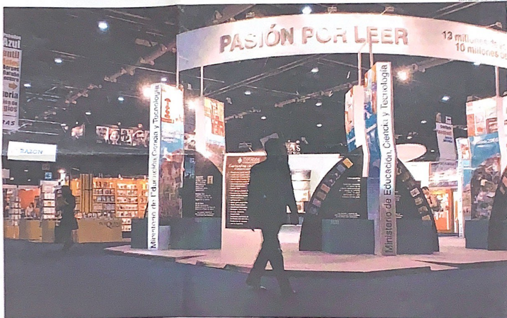
YA LLEGAN. EL AÑO PASADO VISITARON LA FERIA UN MILLÓN DOSCIENTOS MIL LECTORES. AHORA, CREEN QUE SERÁN MÁS.

El informe divide al rubro (300 editoriales) en dos grupos: uno mayoritario, integrado por editoriales pequeñas —nacionales y extranjeras— y un reducido número