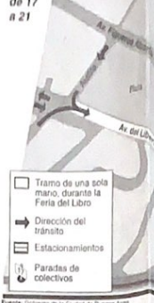
Mapa del Centro de Exposiciones de la Feria del Libro