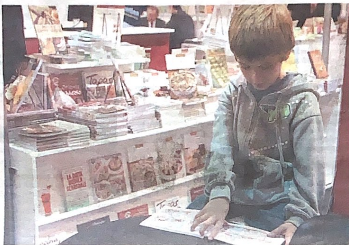
Varias editoriales chicas decidieron compartir un stand en la Feria para lograr más visibilidad.

Sin largas colas en las cajas para pagar los libros o para conseguir una firma de un escritor, pero con inquietudes y ejemplares atractivos, las editoriales chicas buscan en la Feria conquistar más visibilidad y nuevos lectores.