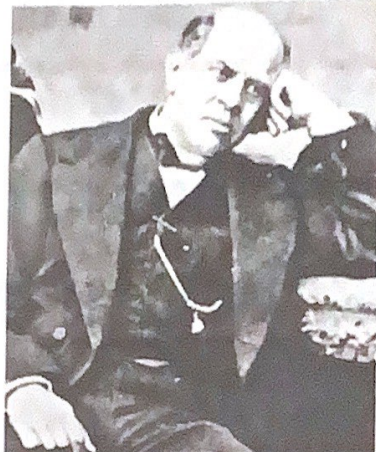
CLASICO Y MODERNO. ENTRE LOS CANDIDATOS A SER TRADUCIDOS ESTAN DESDE SARMIENTO HASTA MARTIN KOHAN.