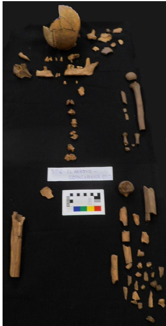
Fotografía N o 1: Vista general de los restos óseos recuperados,