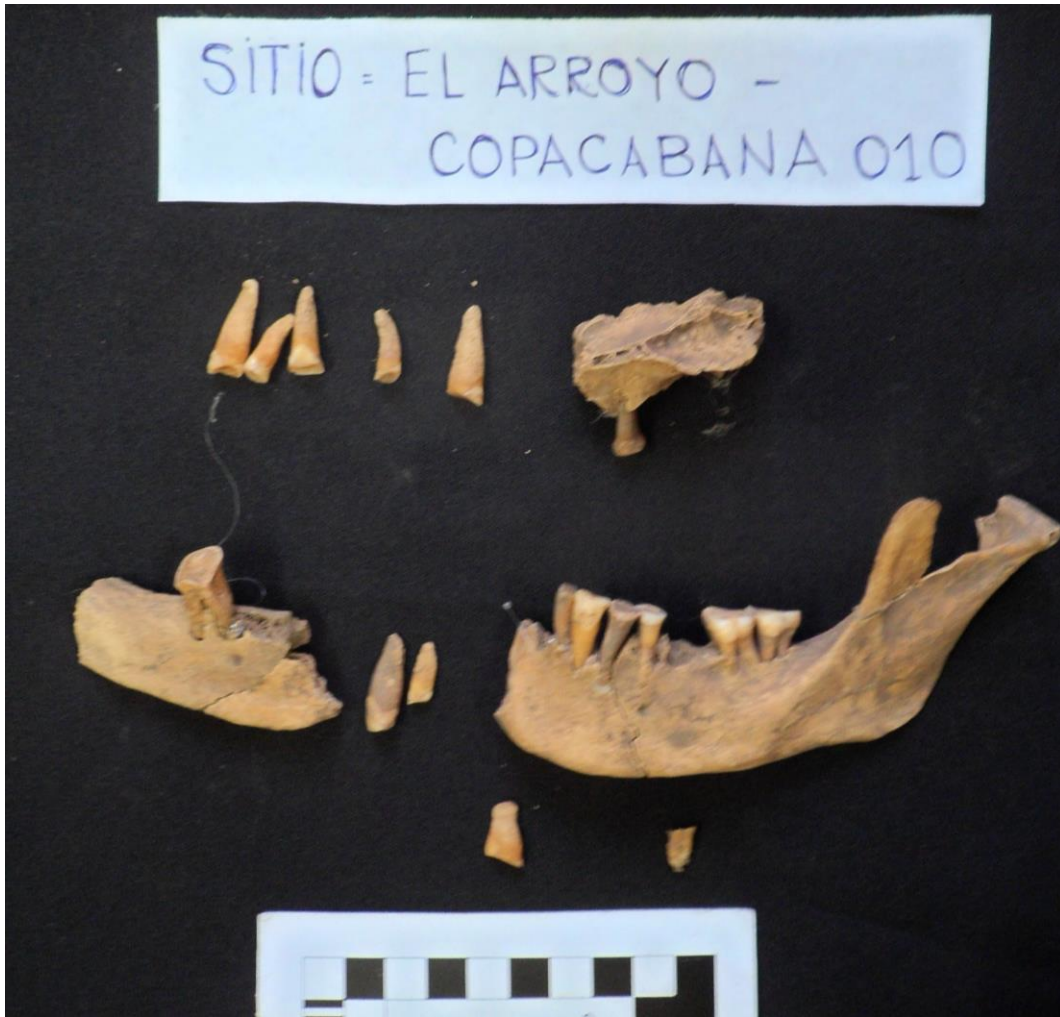
Figura 2. Mandíbula, fragmento de maxilar y piezas dentales recuperadas.